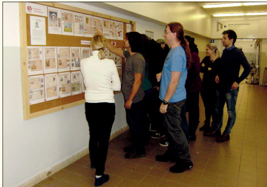
Studenti Západočeské univerzity v Plzni před exponátem.