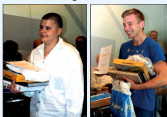
Vítězové kategorií B a C