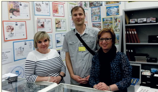
Autor příspěvku na stánku Postfilly na veletrhu v Essenu.