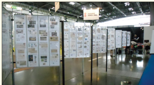
Záběr z květnové výstavy ke 100 letům republiky na výstavišti.

Hned poté se konala stěžejní akce klubu. Byli jsme osloveni jedním z organizátorů oslav 100 let Československa na brněnském výstavišti. Kontaktovala nás skupina, která připravovala expozici o sportu. Někde vystrachali, že v roce 1939 se konaly první všecyklistické dny a bylo tehdy připraveno i příležitostné razítko. Skupina Sportmedia oslovila ČP a náš KFAM, jejím cílem bylo uskutečnit na výstavišti II. všecyklistické dny. Jejich členové si sami zajistili bohatý sportovní program a po ČP chtěli příležitostné razítko a zřízení poštovní přepážky přímo ve výstavních prostorách. My jsme pak měli zajistit výstavku s tělovýchovnou tematikou, zaměřenou na cyklistiku a Věru Čáslavskou. Výběr exponátů zajistil Olympsport. Aby nedošlo k poškození filatelistických materiálů, zhotovili jsme kopie exponátů. Hned vedle výstavních rámců bylo totiž hřiště na házenou a z druhé strany se bojovalo v kolové, takže