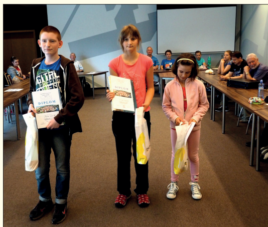
Vítězové kategorie Z

Akce začala v pátek, kdy se účastníci FO vydali na prohlídku Prahy. Vlastní soutěž byla zahájena v sobotu dopoledne, za účasti členů KMF z celé České republiky. V první části soutěže museli účastníci prokázat odborné filatelistické znalosti i znalosti o tématu FO. Tím byla letos „Architektura“. Pak následovala tvorba vlastních albových listů na dané téma, přičemž způsob zpracování si mohl každý zvolit podle svého. Někteří použili tradičnější pojetí jako např. památky UNESCO, jiní prokázali vlastní invenci a zpracovali třeba témata jako Stavby Karla IV. nebo Užitečná architektura. Na většině listů bylo vidět, že soutěžící mají potřebné dovednosti a znají pravidla pro tvorbu exponátů.