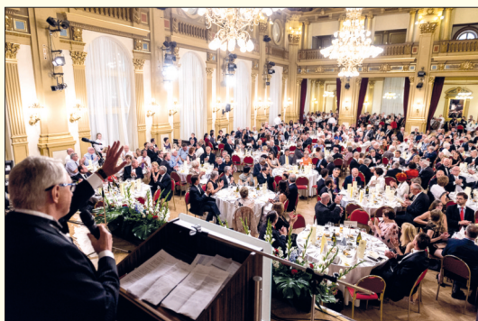
Slavnostní vyhlášení výsledků - palmáře - proběhlo ve velkém sále Národního domu na Vinohradech.