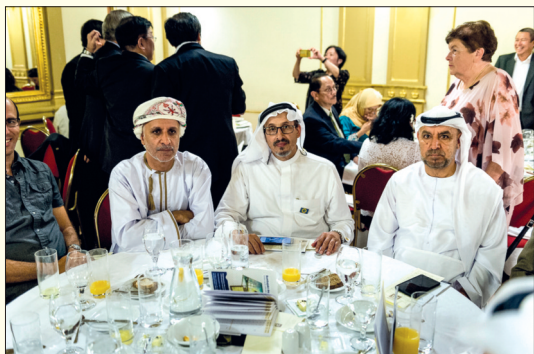
Někteří účastníci z exotických zemí přišli na palmáře v tradičním slavnostním oblečení své vlasti.