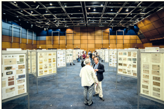
Druhý den ráno bylo ve výstavní hale kongresového centra Clarion už vše nachystáno pro první návštěvníky.