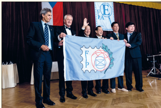
Na závěr byla předána, jako symbolická štafeta, vlajka FIP do rukou organizátorů následující výstavy BANGKOK 2018.