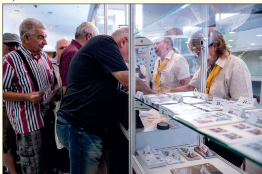
O naše krásné nové známky byl ve stáncích České pošty veliký zájem.