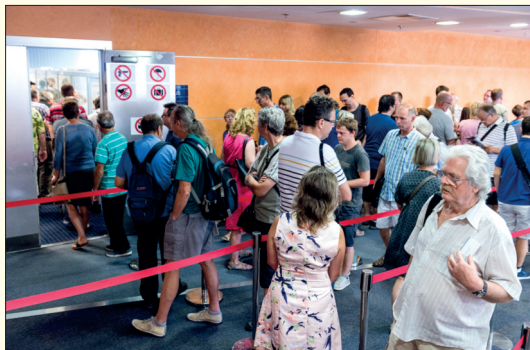
O výstavu a její Čestný dvůr byl po celou dobu konání velký zájem, až tomu zahraniční návštěvníci ani nemohli uvěřit.