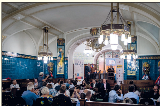
Výstava byla slavnostně zahájena v úterý 14. 8. v podvečer v Obecním domě v Praze.