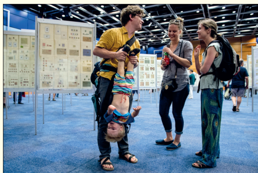
Výstavy se zúčastnili i rodiče s dětmi. V tomto případě lze konstatovat: „Dělej co dělej, Mauritia z něj nevytřepeš“.