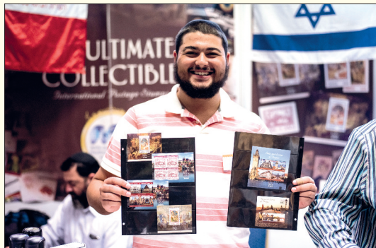
Na stánku izraelské pošty nabízeli i řadu aršíků s našimi motivy.