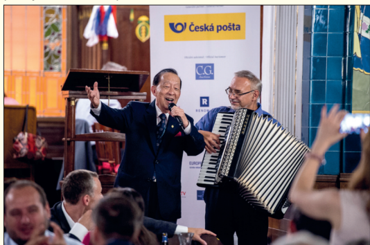
Prezident FIP se ukázal jako velmi zábavný společník, za doprovodu místního harmonikáře dokonce zaspíval.