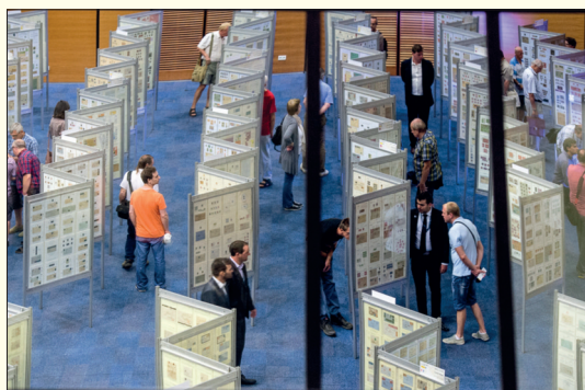
Aby se vešlo co nejvíce výstavních rámců, uličky mezi nimi byly poměrně úzké. Návštěvníci se však chovali ohleduplně.