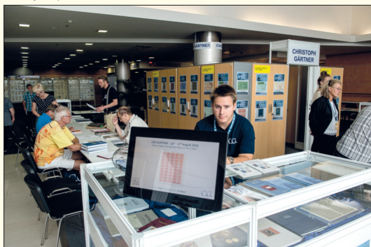
Aukční partner výstavy, firma Gärtner, představil na svém stánku mnoho úžasných známek a rarit.