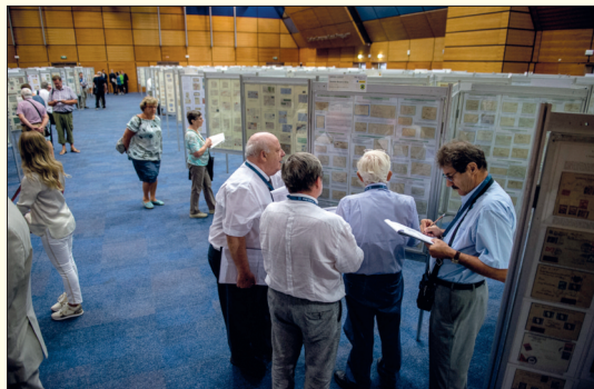
Členové jury trpělivě obcházel jednotlivé exponáty a vyřňovali bodovací tabulky.