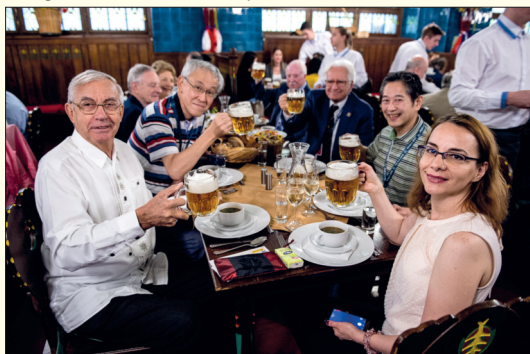
Mezi třemi stovkami přítomných byla řada národních komisařů a členů jury, pivo všem zjevně chutnalo.