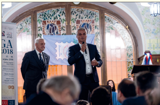
K účastníkům promluvil i nový generální ředitel České pošty Roman Knap.