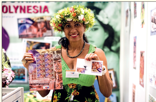
Nejexotičtější byl stánek pošty Polynésie, kde nabízeli i známku M. R. Štefánikem, který tam působil jako astronom.