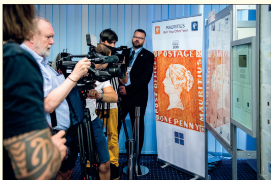
Největší zájem zástupci sdělovacích prostředků projevovali o první známky ostrova Mauritius.