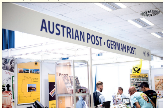
V hotelu Olympik probíhalo EXPO, jehož se zúčastnila i řada zahraničních poštovních správ.