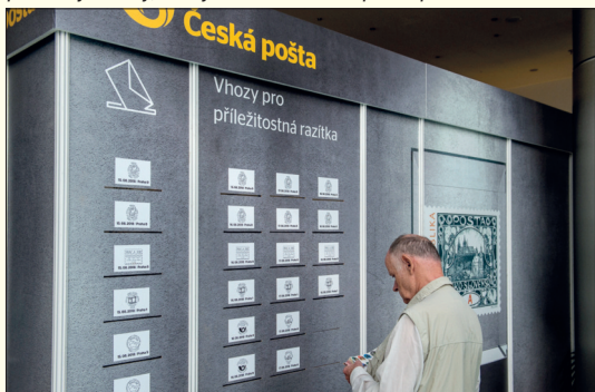
Stánky České pošty byly snad nejkrásnější, jaké kdy na nějaké výstavě měla. Zde stěna s vzhovacími otvory.