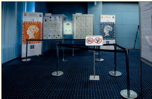
Aby se předešlo předbíhání, byly v Čestném dvoře připraveny uličky, kterými návštěvníci postupovali.