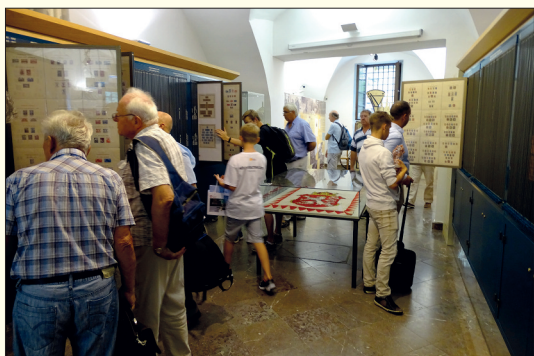
Návštěvníci výstavy si v Poštovním muzeu kromě vystavené literatury se zájmem prohlíželi i stálou expozici.