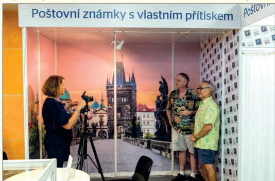
Návštěvníci výstavy se mohli dát ve stánku České pošty vyfotografovat a hned si odnést svůj portrét na kuponu.