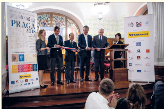
Symbolickou „startovní“ pásku přestřihli (zprava) předseda OV, generální ředitel ČP a předsedové FIP a FEPA.