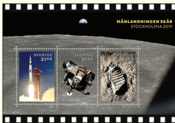
Švédský aršík vydaný k výstavě Stockholmia 2019