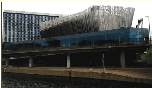
Waterfront Congress Centre Stockholm.

založení v roce 1869. Stala se nejstarší dosud existující filatelistickou organizací na světě. Toto kulaté jubileum oslavila na „klubové výstavě“, pořádané pod patronátem britské královny a švédského krále ve Stockholmu. Výstava i její doprovodné akce probíhaly v prostorách moderního konferenčního centra Waterfront, nacházejícího se nedaleko proslavené stockholmské radnice. Výstavu zahájil osobně švédský král Karel XVI. Gustav, který ji nejen formálně otevřel, ale sám si expozici i prohlédl. Představeno tu bylo na 400 soutěžních exponátů.